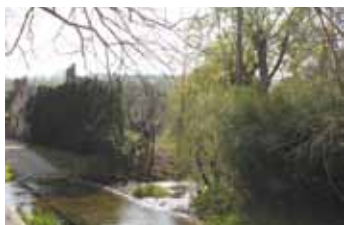
Le gué du Moulin de Pouilly