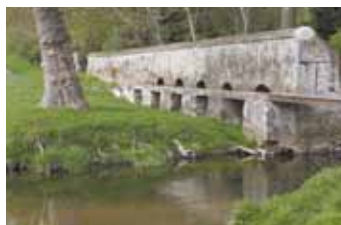
Le gué du pont de Fer